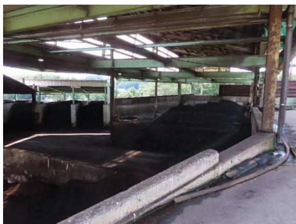
原料発酵処理施設