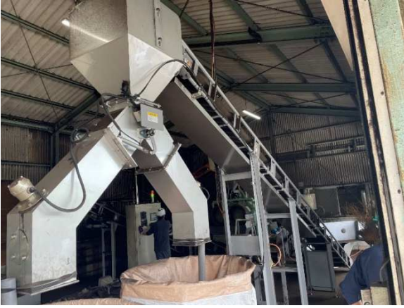
ペレットをフレコンバックへ