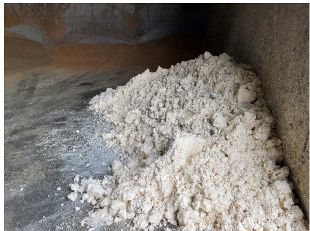
飼料に配合するオカラ