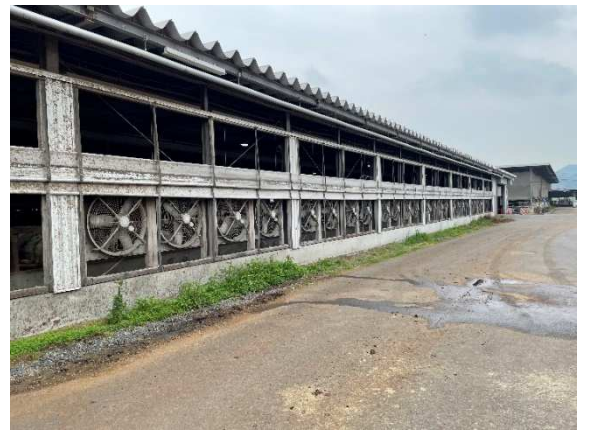
風が下に行くように天井からビニール