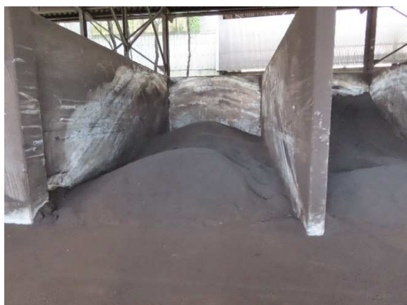
製品発酵製造施設